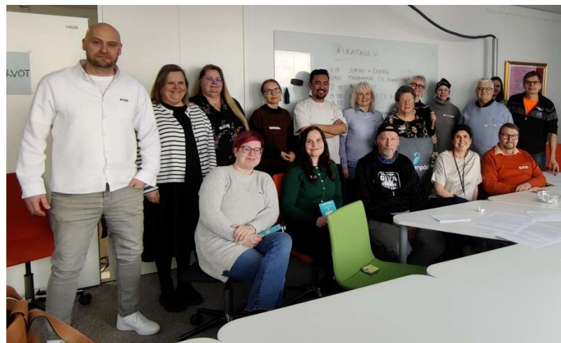
Strategiaraati 14.3. työpajapäivän päätteeksi.